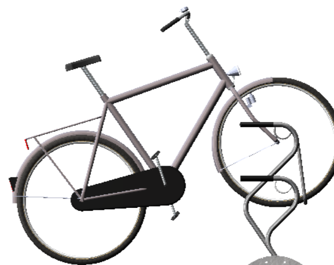
K1520, Cobra Light 2E single-sided - h.2.h. 375 mm